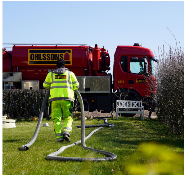
Ohlssons AB är ny entreprenör på vår slamtömning.

Har du sålt din fastighet ? Vill du beställa/ ändra ditt sopabonnemang? Har du inte fått ditt kärl tömt? Vill du beställa ett trädgårdsavfallsabonnemang? Har du vitvaror som du vill få hämtade? På vår hemsida under kundtjänst/anmäl själv finns formulär som du enkelt kan fylla i och skicka in till oss.