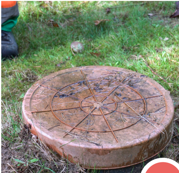
Exempel på lätt lock